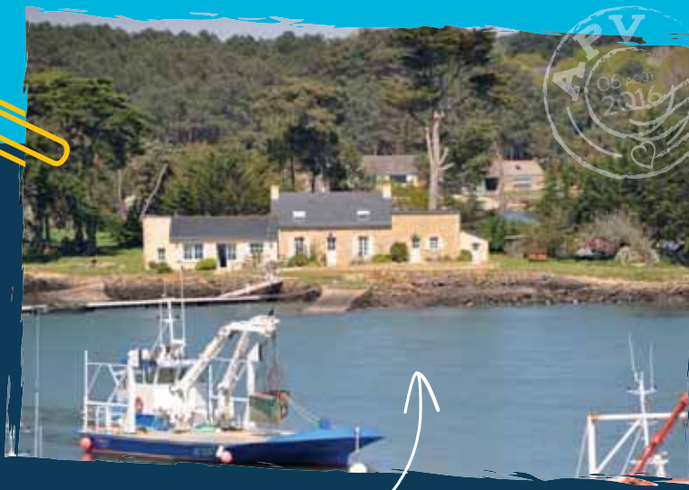
Le caractère Breton